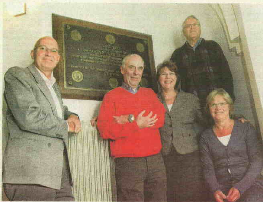
Het bestuur van de stichting Schenectady bij de gedenkplaat die een Amerikaans gezelschap in de zomer van 1990 onthulde in de Grote Kerk.

„De 'Stockade', zoals het historische stadscentrum wordt genoemd, is een juweeltje om te zien. De straten