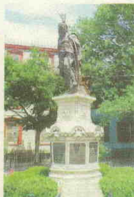
Standbeeld in Schenectady.

Een wandelingje langs de Nijkerkse politiek leert dat de fracties niet afwijzend staan tegenover meer inzicht wat zo'n stedenband precies zou kunnen inhouden. Dit zou kunnen in de vorm van een ambtelijke notitie waarin de voors en tegens goed tegenover elkaar worden afgewogen, zodat er in de raad over kan worden gedebatteerd, aldus de woordvoers. Bij de fracties bestaat overigens grote waardering voor de bestaande initiatieven. Dit geldt ook voor het college van b en w. Renkema wijst in dit verband op de gezamenlijke proclamatie van de gemeentebesturen van Nijkerk en Schenectady, die vorig jaar werd uitgegeven ter gelegenheid van het 25-jarig bestaan van de innige banden en het uitwisselingsprogramma tussen beide steden. Onder de proclamatie staan de handtekeningen van Renkema en zijn Amerikaanse ambtgenoot, Stratton. (Peter Niehorster)