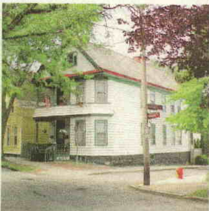
Hendrick Brouwer House in The Stockade, een van de voorbeelden van Hollandse architectuur.