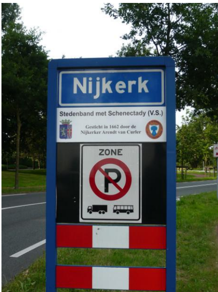
Het bord bij de entree van Nijkerk.